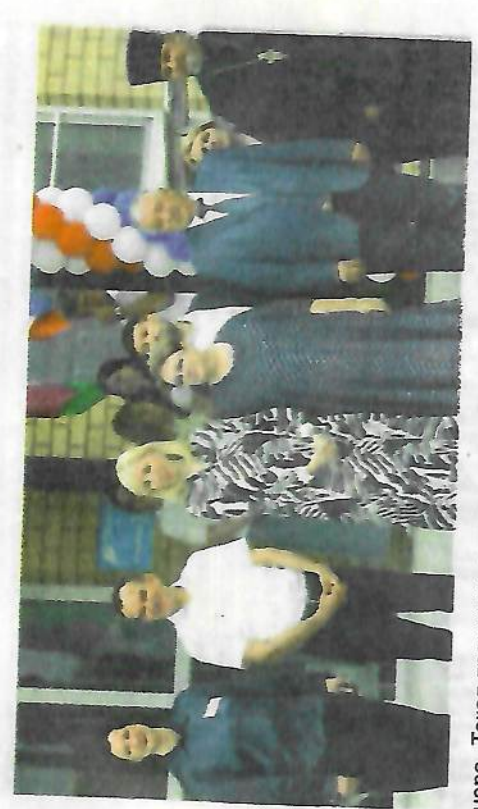
Такая традиция существует, ... Поздравляем всех с замечатель-